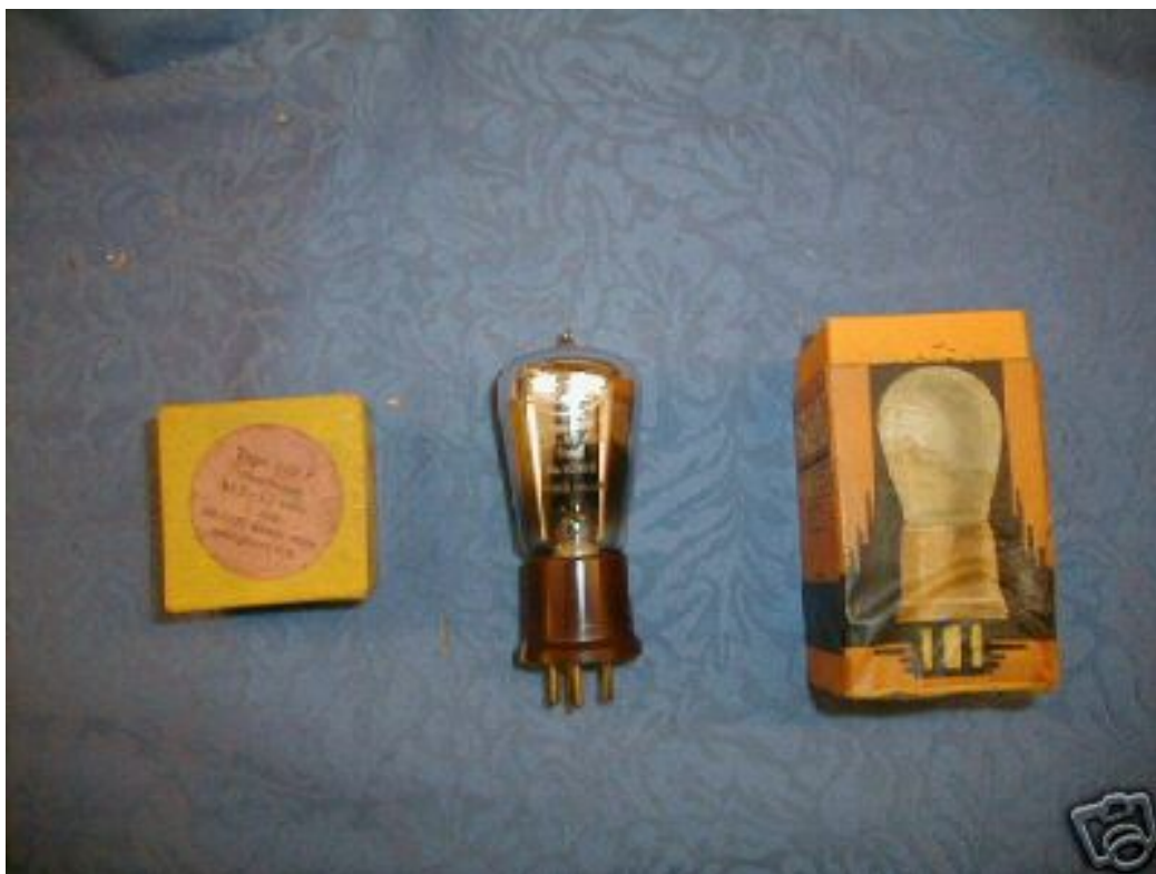
Een Frelat 210P