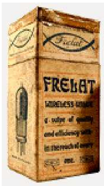
Doosje Frelat DKP

Dezelfde Frelat type DKP staat op www.hupse.nl Dus op een Nederlandse website.